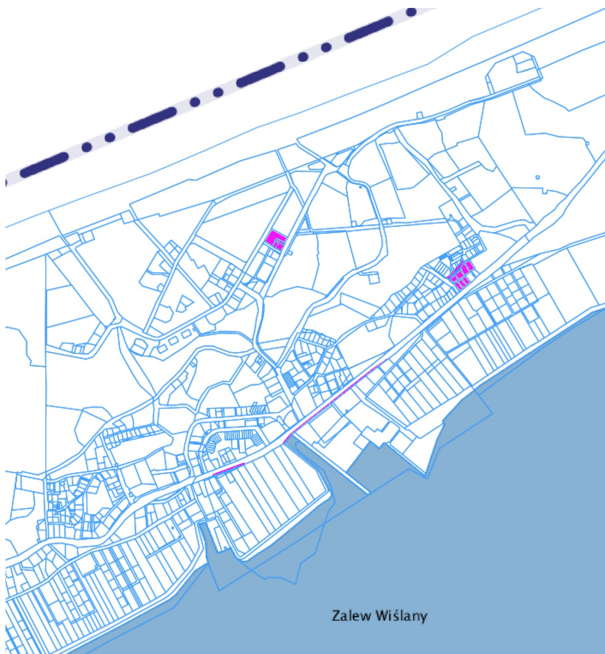
Lokalizacja terenu zmiany planu w stosunku do Obszar Specjalnej Ochrony Ptaków Natura 2000 „Zalew Wiślany” PLB280010