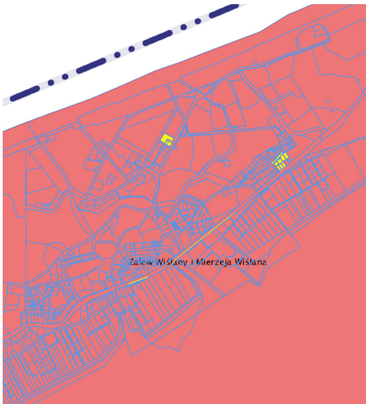
Lokalizacja terenu zmiany planu na tle Specjalnego Obszaru Ochrony Siedlisk Zalew Wiślany i Mierzeja Wiślana PLH280007