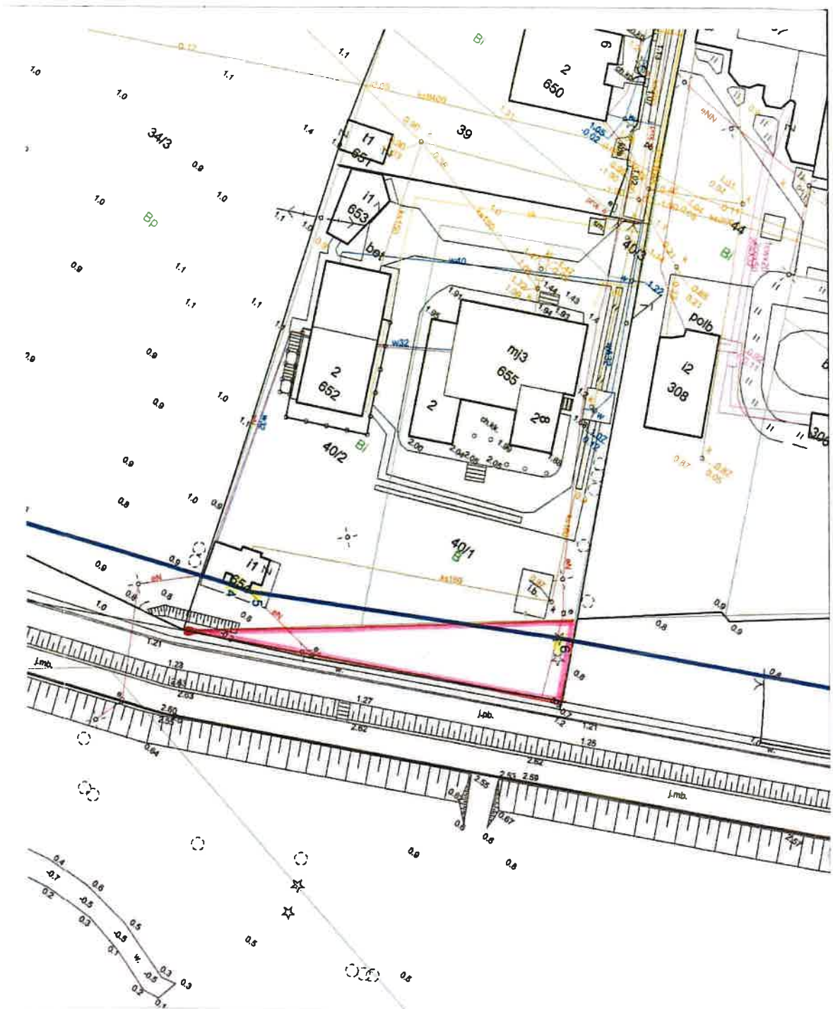
Mapa: Krynica Morska -M Obręb 0001 -Krynica Morska Działka 87/27