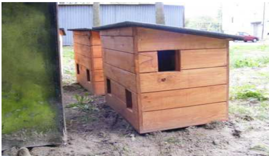
Przykładowe zdjęcie budki dla kotów