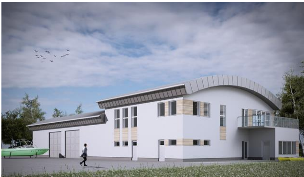
Rys. 1 . Budynek do obsługi portu

Projekt finansowany w ramach: Regionalnego Programu Operacyjnego Województwa Pomorskiego na lata 2014 – 2020 8.4 Wsparcie atrakcyjności walorów dziedzictwa przyrodniczego.